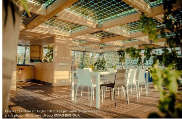
Essence : Terrasse en FRENE THT (traité par haute température) crédit photo - Clickandwatch pour ENSAG-INES-GAIA